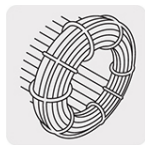
Bobinas de cobre