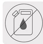
Libre de mantenimiento