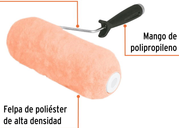
Maneral de acero galvanizado