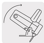
Capacidad biselado 0-45°