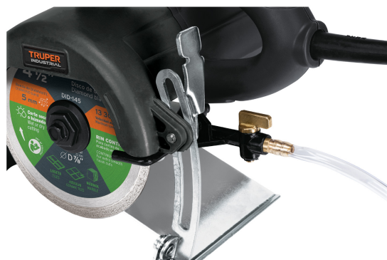
Sistema de lubricación de corte