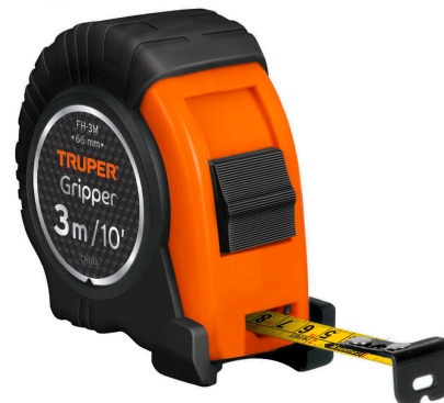
Cinta impresa por ambos lados