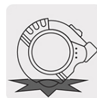
Resistente a impactos