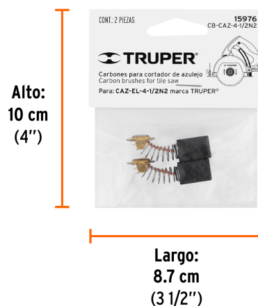
Peso: 0.01 kg (0.02 lb)