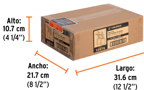
Contiene: 8 inner (96 piezas)