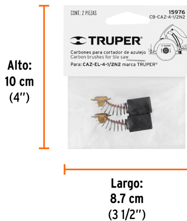
Peso: 0.01 kg (0.02 lb)