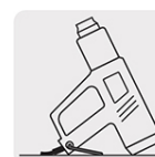
Soporte para trabajar a manos libres