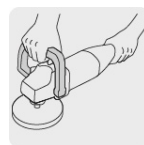
Mango abatible tipo "D"