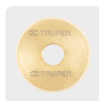
Cuchillas con recubrimiento de titanio