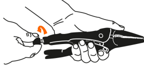
Abertura máxima de la mordaza