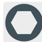
Fijación con tornillo hexagonal