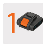
Incluye batería ion litio