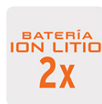
Más tiempo de vida Mayor velocidad de carga