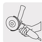
Mayor ergonomía y confort