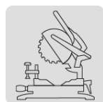
Para sierra de inglete