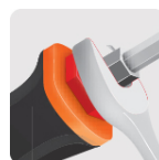
Hexágono en la barra