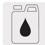
Incluye un bote de 250 ml de aceite monogrado SAE30