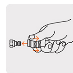
Conexión rápida de latón