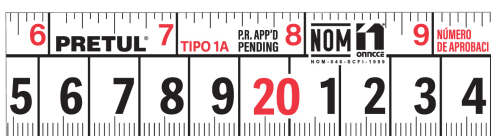
Números grandes de fácil lectura

Cinta blanca cubierta de laca que evita rayaduras y desgaste