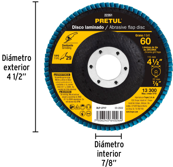
Diámetro exterior 4 1/2"

Las partículas generadas, no causan daño al sistema respiratorio