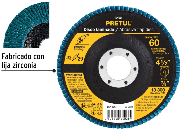
Fabricado con lija zirconia