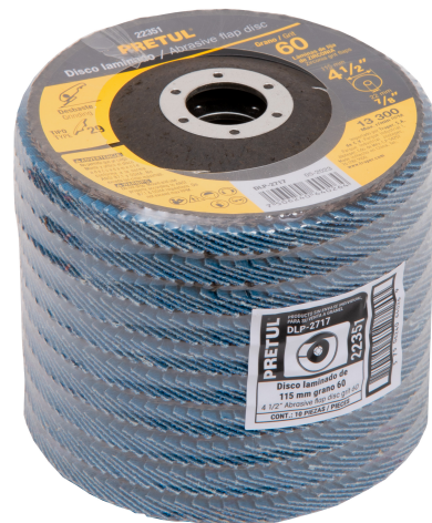
Diámetro interior 7/8"