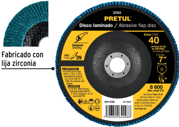
Fabricado con lija zirconia