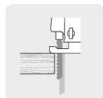
Longitud de carrera