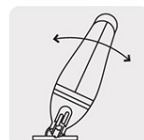
Cortes a 0°, 15°, 30° y 45° por ambos lados