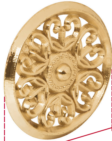
Diámetro 37 mm