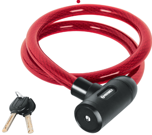
Cable de acero trenzado