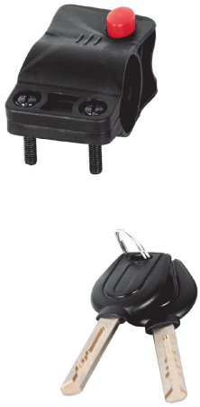
Cable de acero trenzado