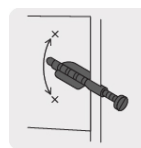
Anclas que evitan el giro