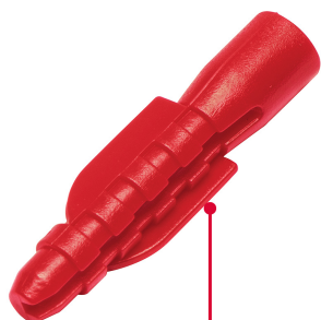
Cinturones de resistencia y anclas retráctiles de fijación