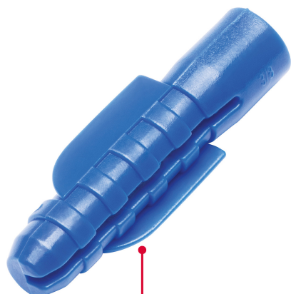
Cinturones de resistencia y anclas retráctiles de fijación