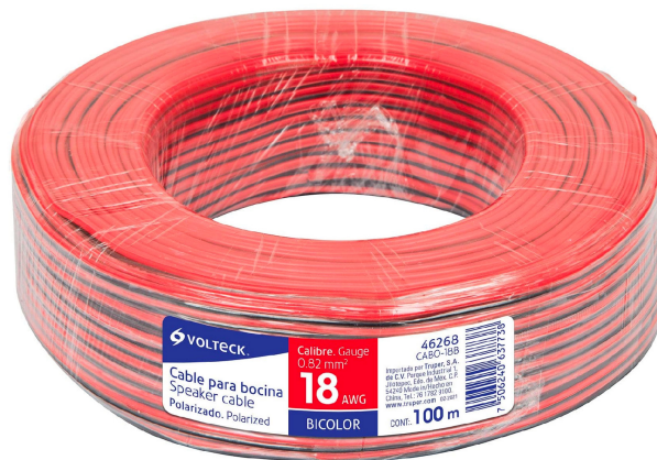
Rollo de 100 m