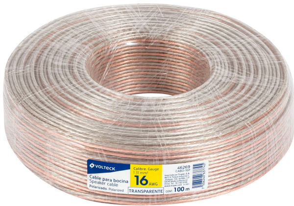
Rollo de 100 m