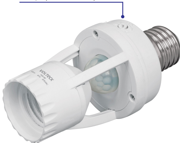
Tiempo y sensibilidad ajustables