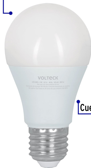
Pantalla de policarbonato