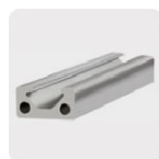
Metales no ferrosos