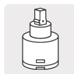
Cartucho cerámico (CARMO-20)