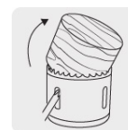
Ranura amplia para remover