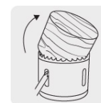
Ranura amplia para remover