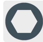
Broca piloto ajustable