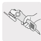
Cuerpo delgado operación a una mano