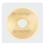
Cuchillas con recubrimiento de titanio