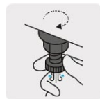
Válvula de drenado