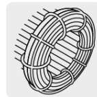
Motor con bobinas de cobre