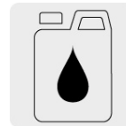
Incluye un bote de 250 ml de aceite monogrado SAE30