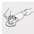
Operación a dos manos