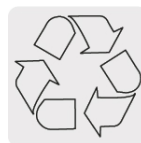
El cobre es un material reciclable