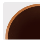
Tipo M Espesor de 0.63 a 0.78 mm