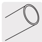
Tubos tipo "M", para presión regular