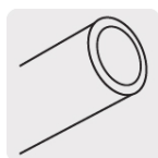
Tubos tipo "L", para presión alta