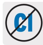
Reduce olor, color y sabor a cloro