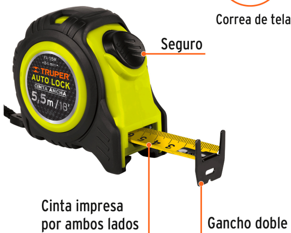
Cinta impresa por ambos lados