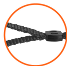
Correa de tela