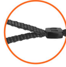
Correa de tela