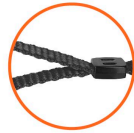
Correa de tela