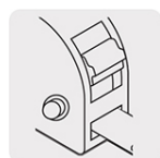
Freno frontal y lateral