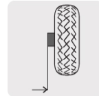
Eje lateral con tubo