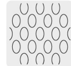
Malla al reverso