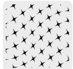
Tejido de punto al frente