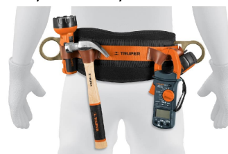
Compartimentos para herramientas