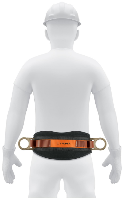
Cinta de poliéster ajustables con hebillas de acero forjado