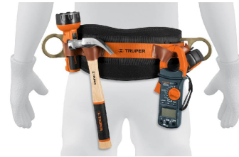
Compartimentos para herramientas