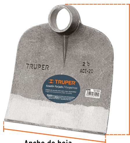
Altura de hoja 8 1/2" (22 cm)