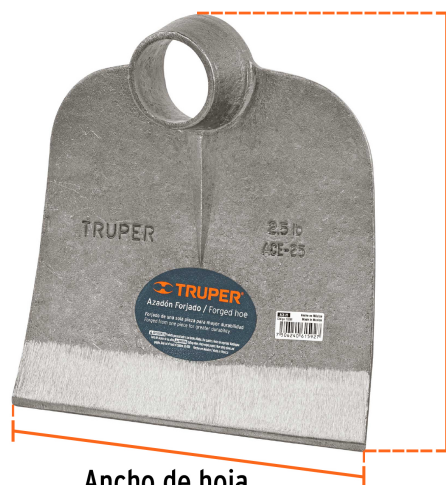
Altura de hoja 9" (23 cm)