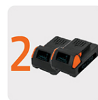
Incluye baterías ion litio